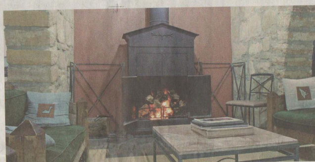
Skupni prostor v motelu RSCN je opremljen tudi s kaminom, saj so zimski dnevi v Dani lahko hladni.