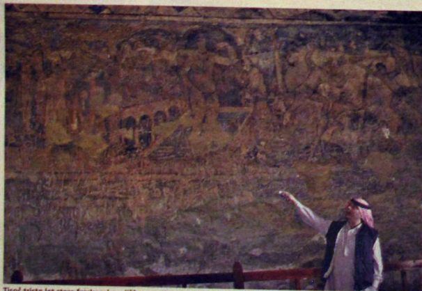
Tisoč tristo let stare freske v kopalniču oaze Qusayr Amra prikazujejo rajski vrt.

Rdeča puščava Vadi Rum je poleg Petra in Mrtvega morja znamenitost, ki jo izpusti redkokateri obiskovalec jugovzhodne Jordanije. Rdečkaste osamele gore iz granita, peščnjaka ali bazalta se kot otoki dvigujejo tudi do 800 metrov iz morja rdečega peska. Gore so različnih fantazijskih oblik in zdi se, kot bi nastale iz kep stajenega vodika pod vročim puščavskim soncem. Gore in pesek skupaj tvorijo obešen, redko posejten labirint, kjer živijo beduini plemen Zalabieh in Zuvajeh. Vadi Rum ima status zavarovanega območja, ki obsega več kot 300 kvadratnih kilometrov. Zjutraj smo se s taksiatom odpravili iz Vadi Muse, pri kraju Rasjdih zavili proti vzhodu, nekaj časa sledili progi fosfatne železnice, po kateri poteka le tovorni promet s kemijskimi produkti Mrtvega morja do pristanišča v Akabi. V stalnem beduinskem naselju Rum smo se preselili na zadnji del terenskega vozila. Naš novi voznik, starejši beduin v tipični opravi, dolgi beli halji in z rdeče-belimi turbanom, je vtaknil ključ in po nekajsekundnem kašljanju je motor vizgal. Ob vsakem postanku ga je ugasnil, in ko ga je spet poskušal zagnati, je trajalo vedno dlje in dlje. Po četrtni vožnji smo se ustavili pri ograji z napajališčem za kamelo. Povzpeli smo se do klifnega previsa. Izpod stene je mezela pitna voda in