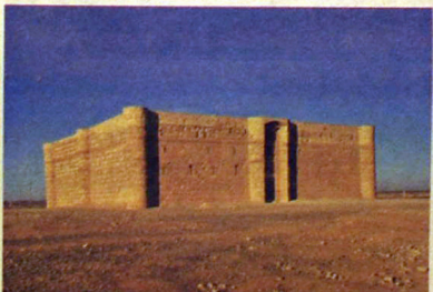
Harana je kockasta utrdba »brez oken in vrat« iz 7. stoletja, kjer so voditelji beduinskih plemen urejali medplemenske zadeve.