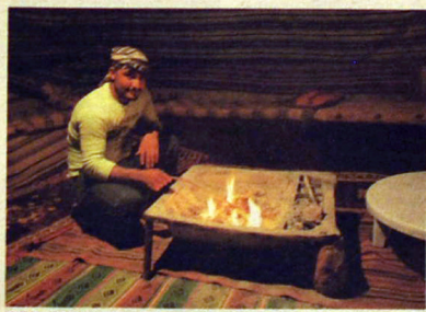
Valid, oskrbnik beduinskega turističnega kampa, pri ognjišču v velikem šotoru.

Po standardnem samopostrežnem zajtrku siva se goskovi. Med vračanjem do vasi Rum smo srečali karavano popotnikov, ki se je odločila za večdnevni trekning po puščavi. Verjetno šele tako, po več dnevi hoje, začutiš prostornost in moč puščave, ki smo ju mi doživeli v instant obliki.