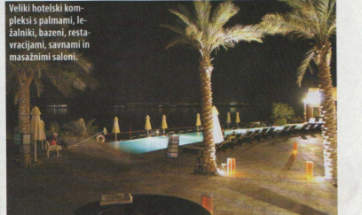
Veliki hotelski kompleksi s palmami, ležalniki, bazeni, restavracijami, savnami in masaznimi saloni.