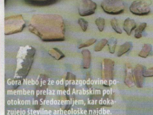
Gora Nebo je že od prazgodovine pomemben prelaz med Arabskim polotokom in Sredozemljem, kar dolobuzujejo številne arheološke najdbe.

Hasemitska kraljevina Jordanija ali Jordanija je obmorska država na Bliznjem vzhodu. Na severu meji na Sirijo, na severovzhodu na Irak, na vzhodu in jugu na Saudsko Arabijo, na zahodu na Iran in zasedeni Zahodni breg reke Jordan, kjer meji tudi na Mrtvo morje. Na jugu ima država pri pristaniškem mestu Akaba v Akabskem zalivu plovisni dostop do Rdečega morja. Glavno mesto Jordanije je Aman, država je ustana monarhija, njen kralj je Abdul II., denarna enota pa jordanski dinar.