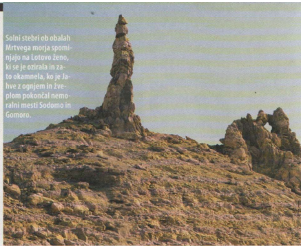
Solni stebri ob obalah Mrtvega morja spominjajo na Lotovo ženo, ki se je ozirala in zato okamenela, ko je lahve z ognjem in žveplom položila nemovalni mesti Sodoma in Gomora.

ozračje dopolnjuje arabska glasba iz televizorja. Motec pa je dim cigaret, ki jih domačini pridno vlečejo tudi v notranjosti lokalov. Preživetje je sicer dobro, vendar če je prosta kakšna minuta pred lokalom, je boljše sesti tja. Lahko si vzamemo čas in si privoščimo vodno pipo z aromatiziranim tobakom in opazujemo domačine, ki v zgodnjem večeru hitijo po opravkih.