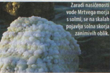
Zaradi nasičenosti vode Mrtvega morja s solmi se na skalah pojavljajo solna skorja zanimivih oblik.