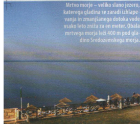
Mrtvo morje – veliko slano jezero, katerega gladina se zaradi izhlapevanja in zmanjšane dotoka vode vsako leto zniža za en meter. Obala mrtvega morja leži 400 m pod gladino Sredozemskega morja.