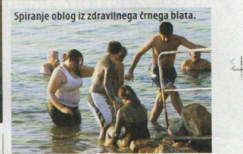
Spiranje oblog iz zdravilnega črnega blata.