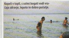
Kopeli v topli, s solmi bogati vodi vračajo zdravje, lepoto in dobro počutje.