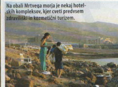
Na obali Mrtvega morja je nekaj hotelskih kompleksov, kjer cveti predvsem zdravilški in kozmetični turizem.

či kapne v oko ali pride v nosno sluznico, jo je treba takoj izprati s sladko vodo. Sicer zelo, zelo peče! No, letovišča imajo lepo urejene plaže z vso infrastrukturo, ležalniki, senčniki, bari in restavracijami, prhami in dostopom do morja. Zaradi monopola pa imajo astronomске cene. Te poleg nadležnih muh edine kvarijo ta raj na zemlji. Za popoln užitek na Mrtvem morju je priporočljivo, da se vsaj enkrat po vsem telesu namažemo tudi z odviskavljenim, zdravilnim črnim blatom, ki ga kopalski moštri na plažo vozijo v velikih čebrih. Sloj blata se v suhem zraku in na vročem soncu hitro strdi. Nato ga lahko kar otreseš s kože, kopele v morski vodi pa odstraniš le preostanek. Rezultat je gladka in zdrava koža. Vsi, ki po tej lepotilni kuri spoznajo, da brez tega blata res ne bodo mogli več živeti, si ga lahko kupijo v drogerijah skupaj z drugimi lepotnimi pripomočki iz Mrtvega morja.