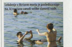
Lebdenje v Mrtvem morju je posledica vzgona, ki nastane zaradi velike slanosti vode.