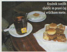
Krožnik svežih slaščic in pravi čaj z vršičkom mete.